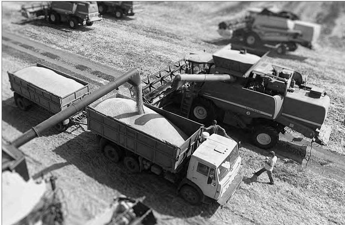
Одинадцятий рік Хмельниччина посідає провідні місця з урожайності зернових. Серед тих, у кого рекордні намототи, господарства Чемеровецької громади. Значна частина зібраного готова до експорту.